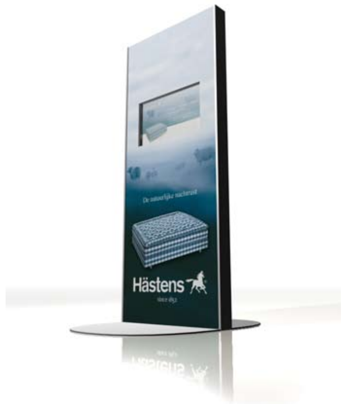
Case Hästens: www.netix.nl

Samen met de medewerkers van Netix hebben we een basis speellijst opgesteld. Zij hebben aangegeven hoe ik de juiste bestanden van ons reclameburo kan opvragen. Het is mogelijk dat ons reclameburo met een eigen wachtwoord delen van de inhoud verandert. Ik heb het gevoel dat ik de regie zelf in handen houd. Wanneer daar behoefte aan is, kan ik de mensen van Netix inschakelen voor eventuele ondersteuning bij het maken van content. Via exploitatiepartners van Netix kan ik mijn advertenties plaatsen op de plekken waar mijn doelgroep zich bevindt.”